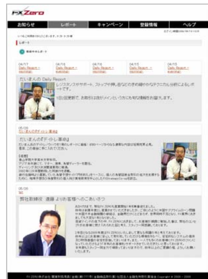
※画像はサンプルです

・ ヘルプ …取引システムの使い方、FX ZERO 取引の取引ルール、よくあるお問合せなどを閲覧することができます。